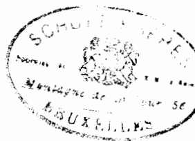
TABLE DES MORCEAUX